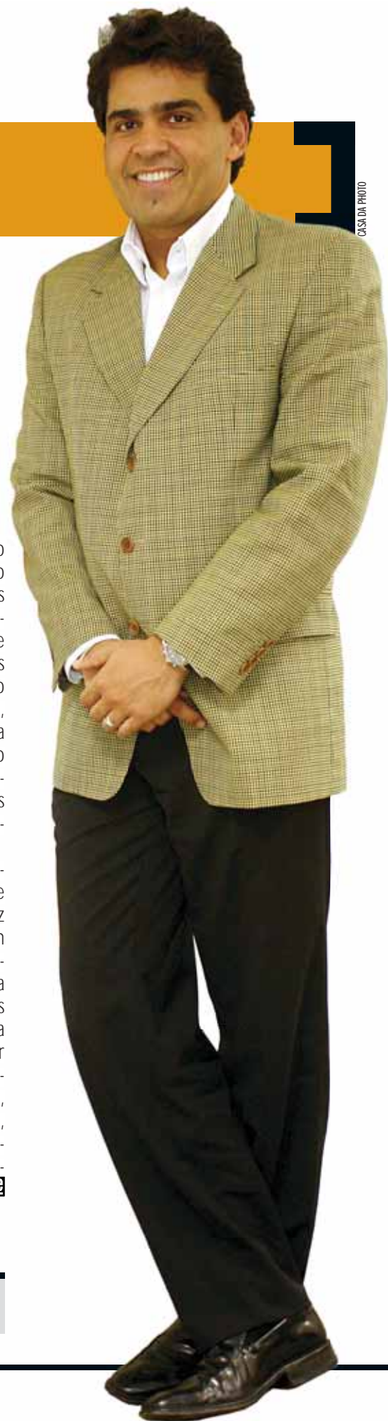
CASA DA FOTÓ